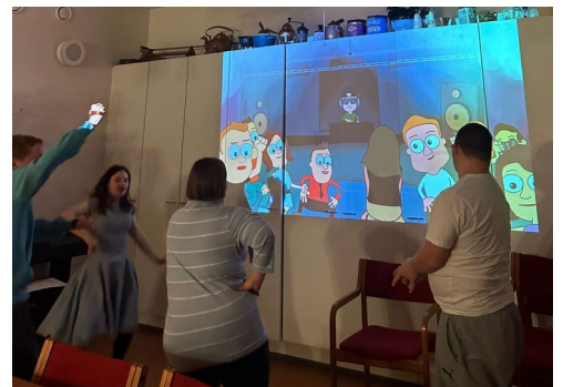
Dansgruppen rockar loss.