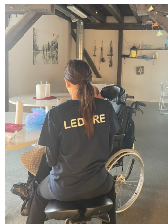
Avslappning i vita rummet och fika på Lördagsträffen.