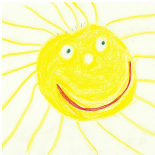
Solen har Uffe målat.

Föreningen fick in över 100 inbetalningar och totalt 41 15 euro.